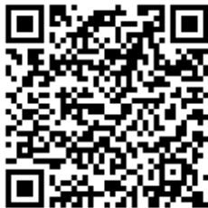
Código QR para validación en sede

Regulación CSV: Decreto 3628/2017 de 20-12-2017